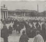
Riba e promer grafici Papa Pablo VI ta lesando e "Profesora di Fe" durante e apertura solem di e Concilio Ecumenico. Riba e otro grafica por mira e participantenan di e Concilio Ecumenico saliendo di e Basilica di San Pedro despues di e promer reunion di e segunda sesion. Atras por mira e Plaza di San Pedro.